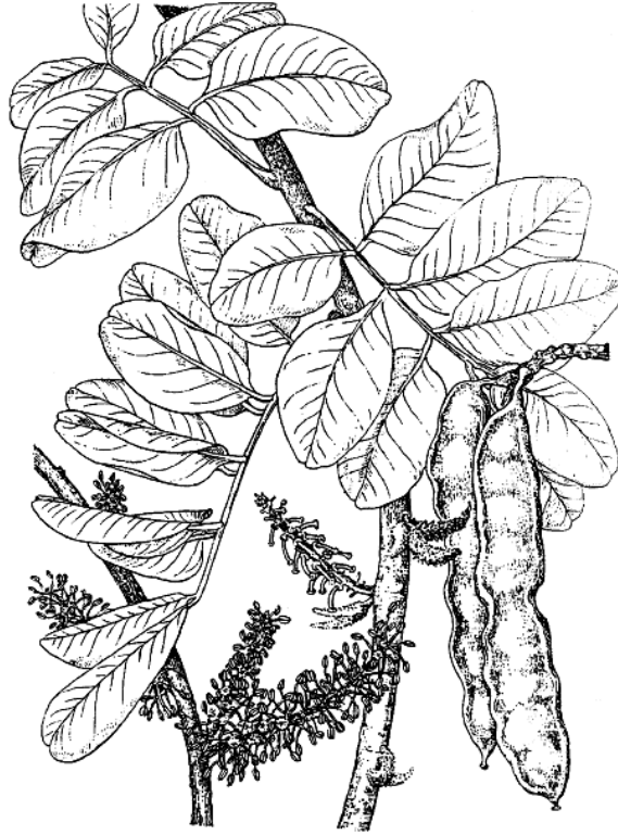
Şekil 1: Keçiboynuzu ( Ceratonia siliqua L.)'nun Yaprak, Çiçek ve Meyvesi (Batlle, Tous'dan)