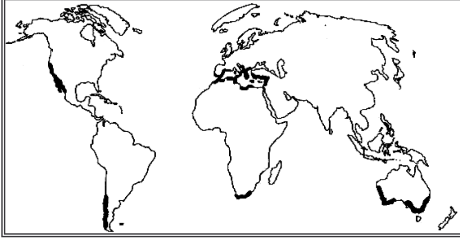
Şekil 2: Keçiboynuzu ( Ceratonia siliqua L.)'nun Coğrafi Dağılımı